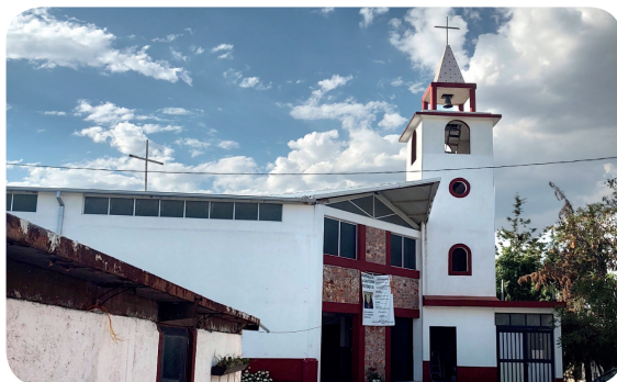
Vue extérieure de l'église Sainte-Monique à Querétaro.