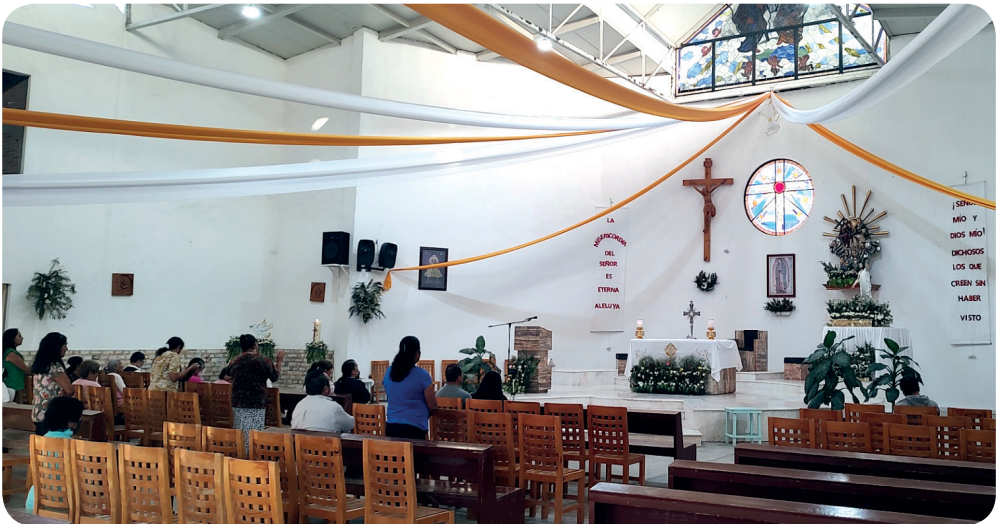
Dans l'église de la Très-Sainte-Trinité.