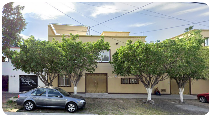
Maison des Missionnaires d'Afrique située dans un quartier de haute densité urbaine à Querétaro.