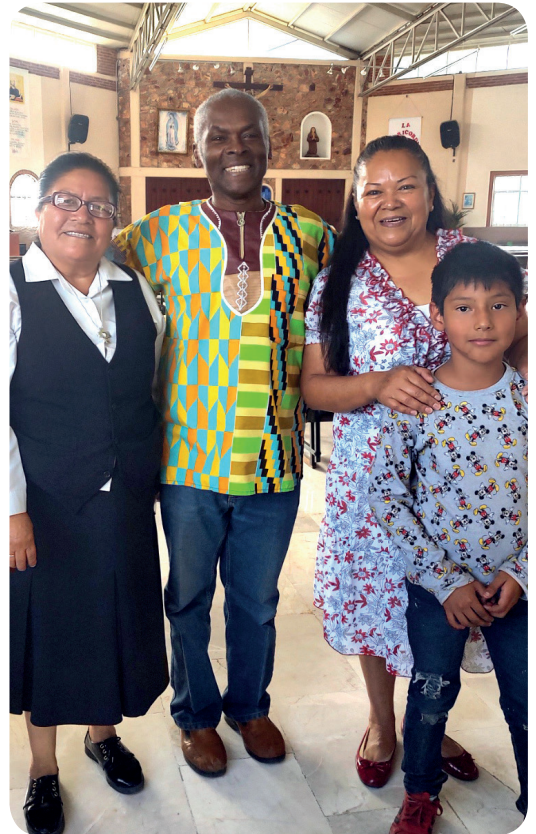
Dans l'église de Sainte-Monique.

Cette croyance est cependant tenace et fragilise même certains membres du clergé. Un jour, il a mis une statuette sur une table lors d'une réunion de prêtres du diocèse. Certains ont pris peur ! Réduite en miettes, les craintes ont disparu sous les coups de marteau prodigués par Rafael.