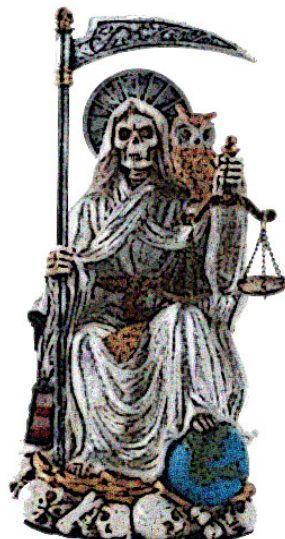
Figurine de la Santa Muerte

Au Mexique, cet équilibre mental est de mise pour faire face à la la Santa Muerte , c'est-à-dire la Sainte Mort . Cette figurine représente la mort personnifiée. Elle est devenue une idole que plusieurs vénèrent au Mexique.